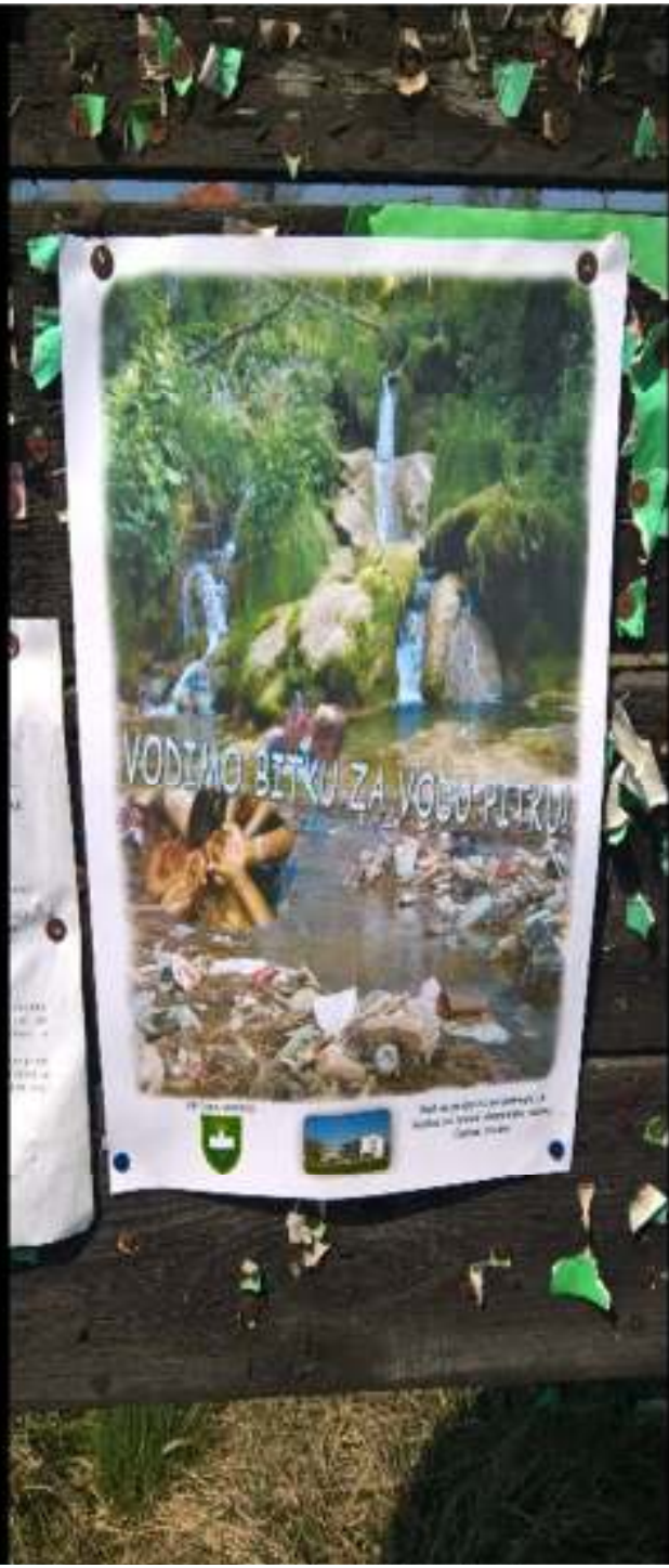
Građevinska sekcija „Ekologija i mi“