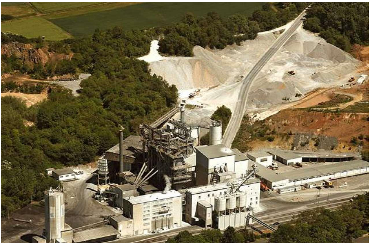
SLIKA PODUZEĆA NA POČETKU RADA

Nažalost, većina navedenog nije ispunjena.